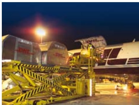
Expédition par fret aérien