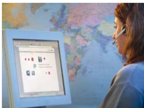
Processus de commande

A l'aide des fonctions les plus différenciées, SECOS vous permet l'identification facile et immédiate des pièces dont vous avez besoin.