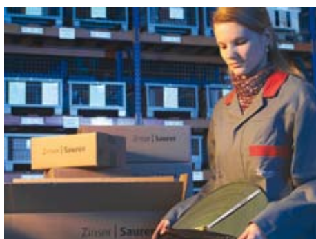
Préparation des commandes

Le magasin de produits illustré par des figures pour les composants vous permet la sélection des articles nécessaires à vos besoins et à vos processus de production.